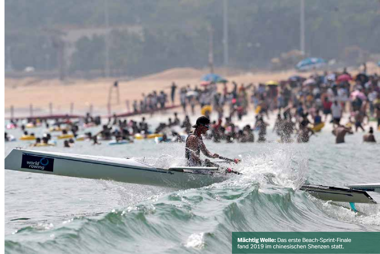
Mächtig Welle: Das erste Beach-Sprint-Finale fand 2019 im chinesischen Shenzen statt.

Die Olympischen Jugendspiele finden 2022 in Dakar, Senegal, statt. Dort werden als Ruderwettbewerb Beach Sprints ausgetragen, eine praxistaugliche Flachwasser-Alternative gibt es dort nicht. Und dies ist das vielleicht stärkste Argument für Coastal Rowing: es erlaubt Küstenreviere und Strände für Wettkampfrudern zu nutzen. Damit kann Rudern an deutlich mehr Orten praktiziert werden und an diversen Wettkämpfen/Spielen teilnehmen. Zudem können mit Coastal Booten auch alle Rauwasser-Gebiete genutzt werden, z. B. Häfen, große Flüsse und offene Seen. In diesem Sinne ist dann das Coastal Rowing die Revolution der Renn-Gigs.