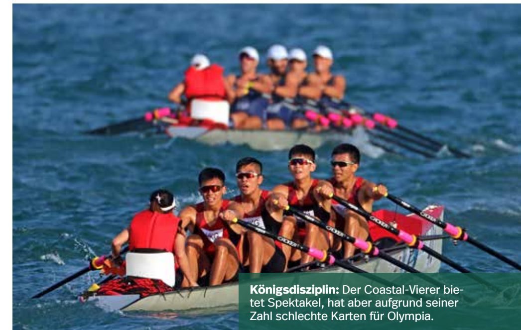
Königsdisziplin: Der Coastal-Vierer bietet Spektakel, hat aber aufgrund seiner Zahl schlechte Karten für Olympia.

Duo: Die Zweier starten bei Weltmeisterschaften bei den Männern, Frauen und im Mixed.